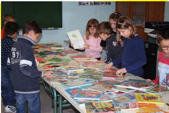
Lire en fête (octobre 216)