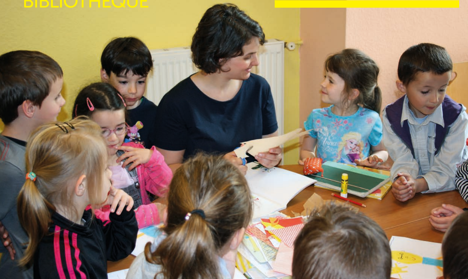
Les InsoLivres (juin 2016)